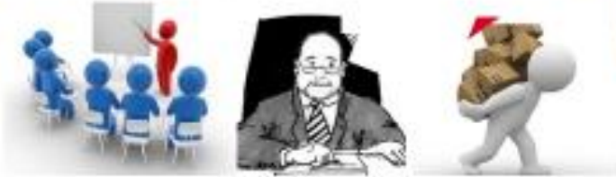
Qualifizierung – Ehrenamtler – Mentoren / Berater